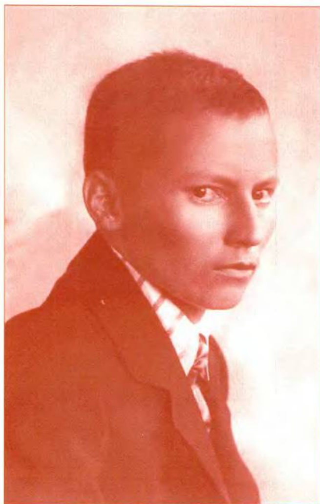
Табдулла Тўқай (1886-1913)