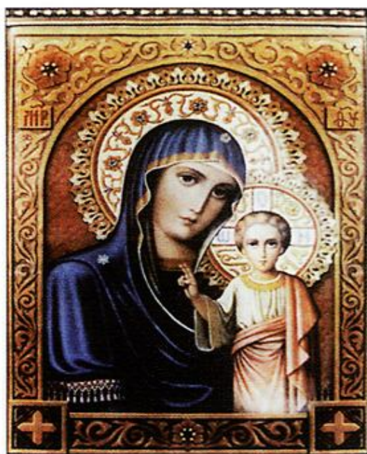
Казанская икона Божией Матери, хранящийся в г. Дамаске (Сирия)

Богородицной; как любовь детей к матери, как стремление жаждущего к источнику, как направленные корабли в тихую пристань, так и нас веселит ваше преуспевание, какое проявляете пред нами ныне. Правосудный Бог, наказывая нас за наши грехи и милостивно наводя на нас гнев Свой то голодом, то нашествием иноплемеников, иногда - мором и междоусобными бранями, иногда же - пожаром и прочими житейскими напастями, наводя на нас разные бедствия, и тяжести, и лютые болезни, побуждает тем, особенно ленивых и ожесточенных, к добродетели и наставляет на путь спасения. Вот и пророк Давид говорит Господу: «браздами и уздой свяжешь челюсти их и накажешь многими ранами не приближающихся к Тебе» 4 ; или в другом псалме: «Если (люди) оставят закон Мой и не пойдут в судьбах Моих, и осквернят Мою правду и не сохранят Моих заповедей, посещу жезлом беззакония их, и ранами неправды их, но не отниму от них милости Моей» 5 , - и Апостол говорит: «Кого любит Господь,