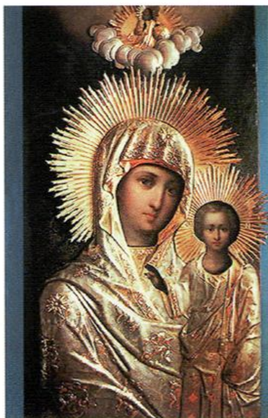
Чудотворная Сикстинская икона Божией Матери (список иконы Казанской Божией Матери, хранящийся на Аляске)

Х отя и предивное чудо совершилось в наши дни милостивым посещением Творца всякого блага, Господа нашего и Бога Иисуса Христа и родшей Его Пресвятой и Преблагословенной Владычицы нашей Богородицы и Приснодевы Марии чрез явление пречудной и чудотворной иконы в преславном городе Казани, но как я, недостойный, возмогу рассказать о сем