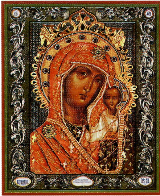
Чудотворная Ярославская-Казанская икона Божией Матери (Ярославский Богородицкий монастырь)

ми, так что совсем не видал света, и тотчас обещался отслужить молебен Пресвятой Богородице. Когда же пришли священники с чудотворным образом Пречистой в день недельный в соборную церковь Благовещения Пресвятой Богородицы к молебну, Иосиф во время молебного пения у чудотворного образа молился прилежно и не получил исцеления и отошел в скорби и снова слег от болезни. И вот впадает он в легкий сон и видит икону святой Богородицы, и был к нему от иконы голос, говорящий: «Встань и пойдь в дом Пречистой, отпой молебен и утри лицо свое пеленою, и тогда получишь исцеление». Он же, вставши вкоре, повелел вести себя в монастырь Пречистой Богородицы и, отпев молебен, повелел покропить себя святою водою, утеретья пеленою Пречистой, и тотчас же отбежала от глаз его болезнь, и увидал он свет и воздал хвалу Богу и Пречистой Богородице.