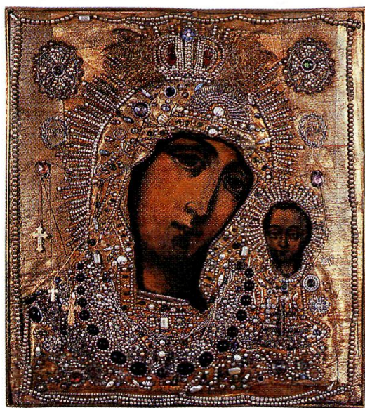
Чудотворный список Санкт-Петербургской—Казанской иконы Божией Матери (Казанский собор в Санкт-Петербурге)