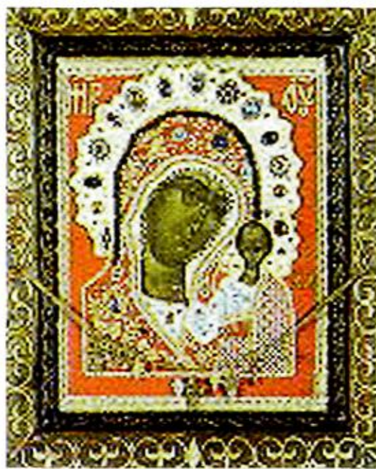
Богородско-Уфимская чудотворная икона Божией Матери

страхом за свое неверие, с плачем молился и просил милости и прощения за свой грех. Также и воеводы с плачем просили милостивого (прощения) за то нерадение и неверие, которыми согрешили пред чудотворным образом Пречистой. И весь народ городской стекался на то дивное божественное чудо и, веселясь со слезами, - в радости душевной - воссылаа хвалу Богу и Богородице за обретение многобогатого и бесценного сокровища. (Я же тогда, бывши в чине священника у святого Николая, который зовется Гостинным, хотя и был каменноесердечен, однако прослезился и припал к Богородицыну образу и к чудотворной иконе и к превечному Младенцу Спасу Христу, и потом поклонился архиепископу и не просил у него благословения на то, чтобы повелеа взять мне пречудную Богородицыну икону; архиепископ же благословил меня и повелеа мне взять ее). Я же, будучи недостойным, - однако со страхом и радостью прикоснулся к чудотворному тому образу и взял его с того дерева, которое было воткнуто на том месте, где в