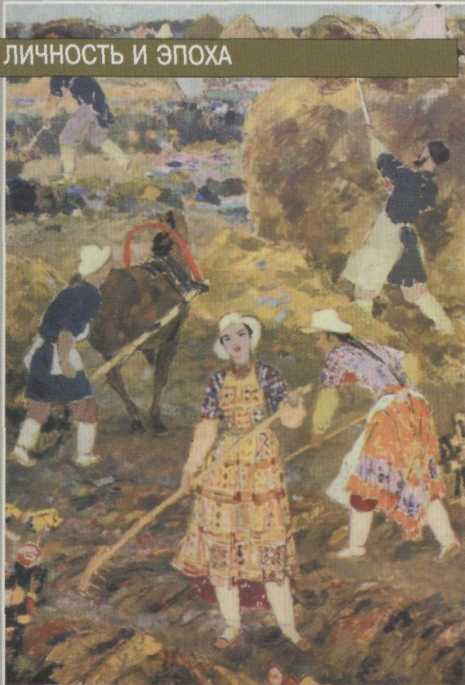
«Сенокос в Салтыке».