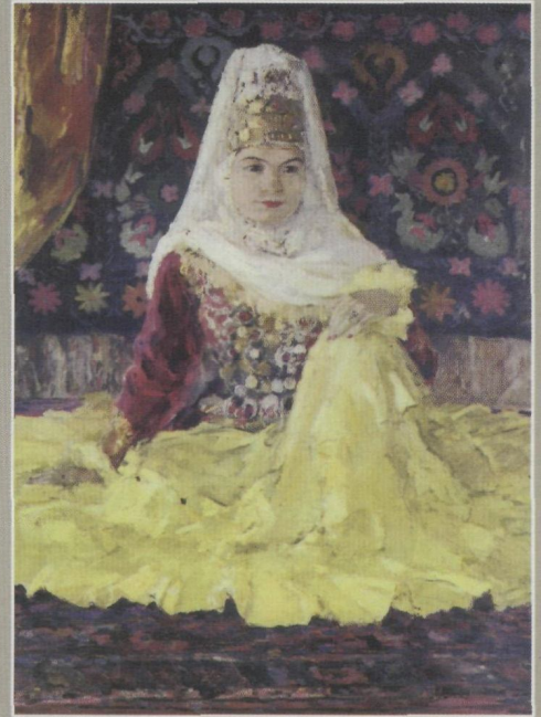
Портрет народной артистки Казахской ССР Жары Жандарбековой.

Терзания и помыслы только об одном, чтобы свобода и счастье низошли на страну и народ.