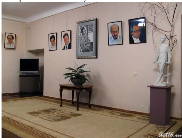
Фото №37032 . В музее Габдуллы Тукая

Из истории народа России, из памяти людской горьких страниц не вычеркнешь. В День памяти жертв политических репрессий, в Литературном музее Г.Тукая, состоялся литературно-музыкальный вечер «В вороньем гнезде (Шариф Камал и репрессированные татарские писатели)».