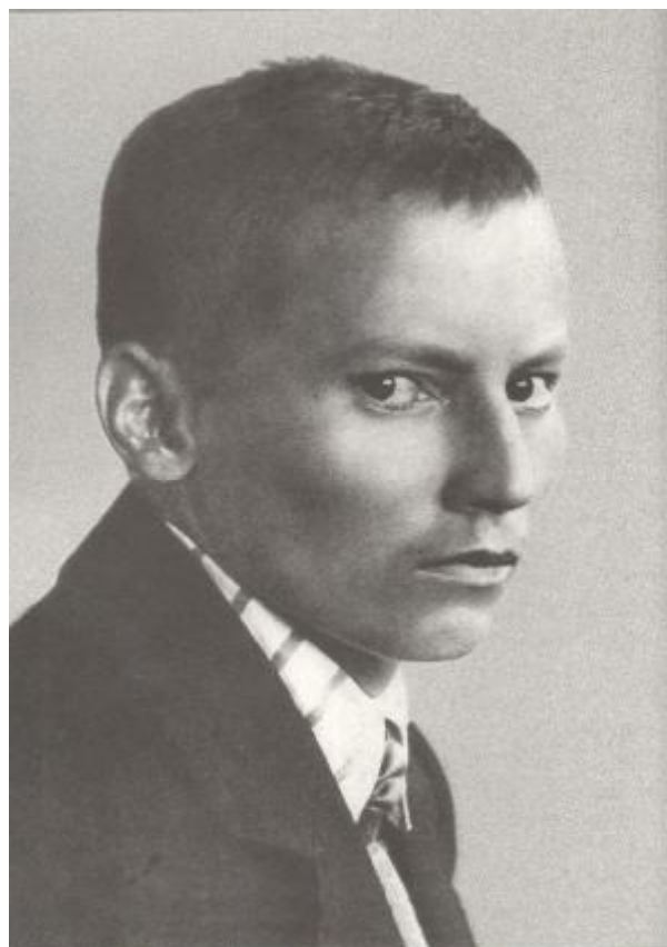
5. Тукайның әсәрләре рус телендә зур тираж белән Мәскәүдә, Ленинградта, Казанда басылып чыга.