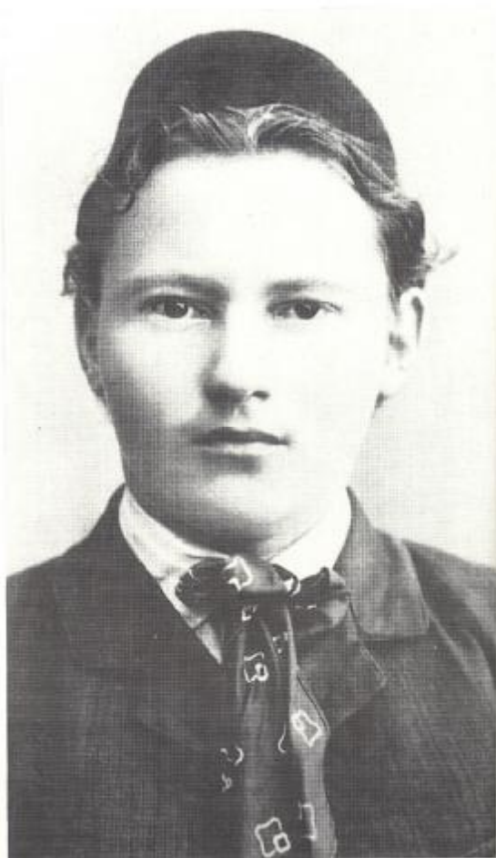
3. Г. Тукай. 1908 ел.