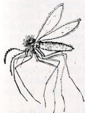
Москит Phlebotomus papatasi , самка.

МОСКІТЫ (исп., ед. ч. mosquito, от лат. musca — муха) (Phlebotomidae), семейство кровососущих двукрылых насекомых. Мелкие (1,2—3,7 мм) мохнатые насекомые, жёлтого, реже серого цвета. Усики 16-члениковые, хоботок длинный, тонкий, крылья остроколенчатые, приподняты над телом. Погрешенный М. не улетает, а передвигается вверх по вертикальной поверхности прыжками.