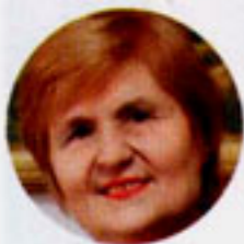
Любовь АГЕЕВА ТЕКСТЫ

ГЫЙНВАР УРТАСЫНДА КАЗАНДА БӨЕК КОМПОЗИТОР ҺӘМ ПЕДАГОГ, КАЗАН КОНСЕРВАТОРИЯСЕНЕҢ «АТАСЫ» НӘЖИП ЖИҢАНОВНЫҢ ТУУЫНА 100 ЕЛ ТУЛУНЫ ТАНТАНАЛЫ ШАРТЛАРДА БИЛГЕЛӘП ҮТТЕЛӘР. СУЗ УҢАЕННАН, 16 ГЫЙНВАРДА КОНСЕРВАТОРИЯДӘ «ДӨНЬЯ ЯКТЫ БУЛСЫН ӨЧЕН ЖЫРЛЫЙМ МИН...» ӘДӘБИ-МУЗЫКАЛЬ МОНОСПЕКТАКЛЕ КУЕЛДЫ. СПЕКТАКЛЬНЕҢ НИГЕЗЕНӘ МАЭСТРОНЫҢ ХАТЛАРЫ САЛЫНГАН, Ә УЛ ЭПИСТОЛЯР ЖАНРНЫ, ӘЙТИК, ОПЕРАДАН КИМ ЯРАТМАГАН. НӘЖИП ГАЯЗ УЛЫ ҺӘР УҢАЙДАН ХАТ ЯЗАРГА ЯРАТКАН, КАЙВАКЫТ АЛАРНЫ ТОЗЛЫ-БОРЫЧЛЫ ИТӘРГӘ, ТӨСЛӘРЕН КУЕРТЫП ЖИБӘРЕРГӘ ДӘ КЫЕНСЫНЫП ТОРМАГАН. МУЗЫКАНТНЫҢ БАШКА ЗАМАНДАШЛАРЫНА ДА ХАС БУЛГАН ӘЛЕГЕ ГАДӘТЕ АРКАСЫНДА, БҮГЕНГЕ КӨНДӨ БЕЗНЕҢ КОМПОЗИТОРГА, АНЫҢ АРАЛАШУ ДАИРЭСЕНӘ ҺӘМ ШУЛ ЧОРГА, АНЫҢ ЦЕНЗУРАДАН ДА КУРКЫП ТОРМАГАН СУЗЛӘРЕ АША КҮЗ САЛЫРГА МӘМКИНПЕГЕБЕЗ БАР