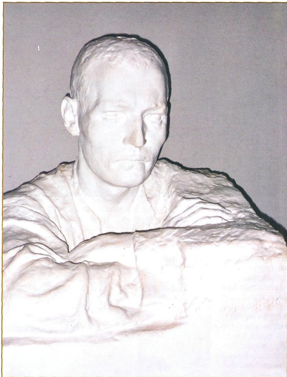
Г.Тукай портреты. 1959. Гипс. 86×90×87 Б.Урманче музсеенда саклана. Казан