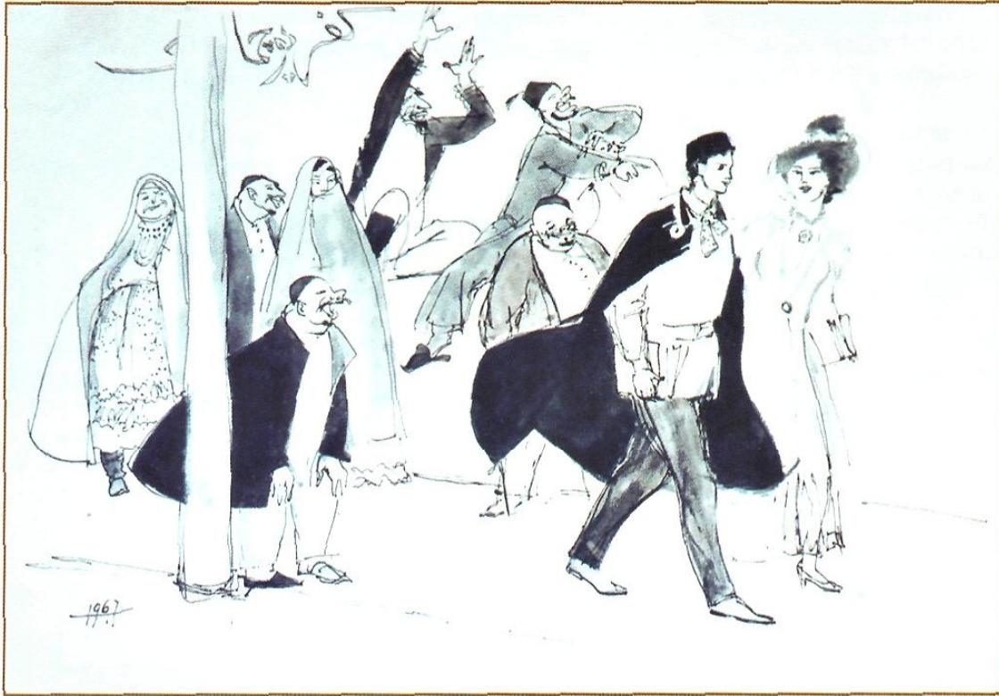
Көфер почмагы. 1977. Кәгазь, тушь. 65×44